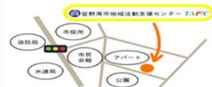
市役所裏手にあった旧食堂（現アパート）のすぐ隣です

「こんな活動やってほしい」「これを作りたい」などあれば お気軽にスタッフへ伝えてください！ ※プログラム活動参加不参加は自由です