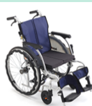
安全番長 とまってい