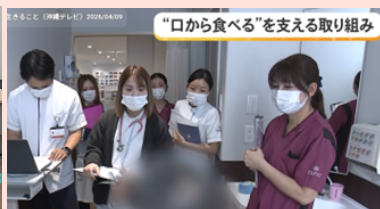
「口から食べる」を支える取り組み