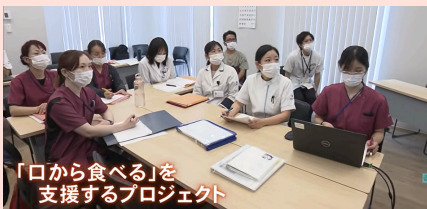
「口から食べる」を支援するプロジェクト